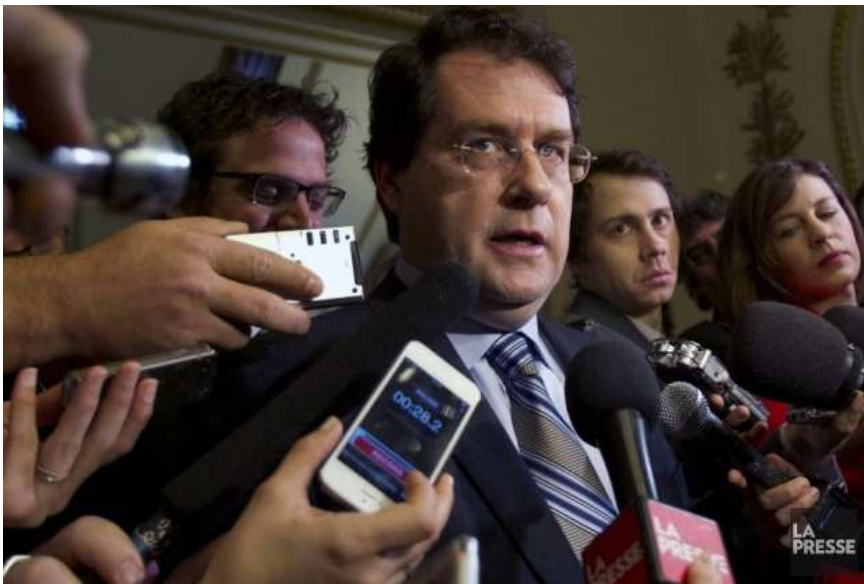
Le ministre des Institutions démocratiques et père de la Charte des valeurs, Bernard Drainville.