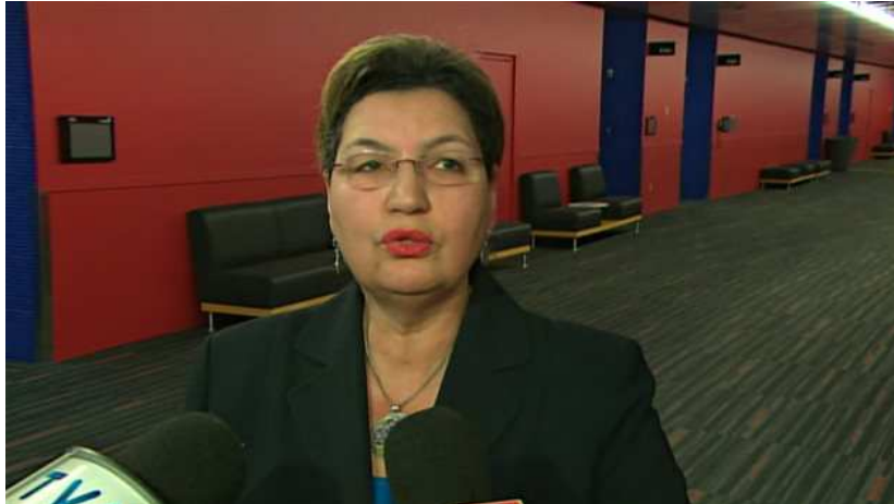
La députée Fatima Houda-Pepin

Mise à jour le mardi 12 novembre 2013 à 20 h 12 HNE